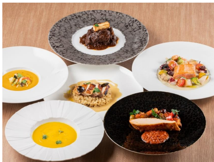
至福のグルメ春メニュー

リゾートトラスト株式会社(以下、リゾートトラスト)のグループ企業である株式会社アドバンスト・メディカル・ケア(東京都港区、代表取締役社長:古川哲也)は、リゾートトラストが運営する完全会員制ホテル 東京ベイコート倶楽部 ホテル&スパリゾート内「RISTORANTE OZIO」(リ스토랑テ オッツィオ)の本格イタリア料理をご家庭でも楽しめるサービス「至福のグルメ」の春メニューを4月5日(月)より発売いたします。