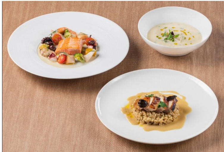
※画像は盛り付けのイメージです