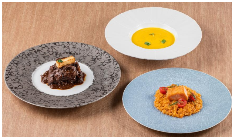
※画像は盛り付けのイメージです

・サーモンとプチトマトのリゾット、カルナローリ米と押し麦、ベジタブルブイヨンで仕上げ