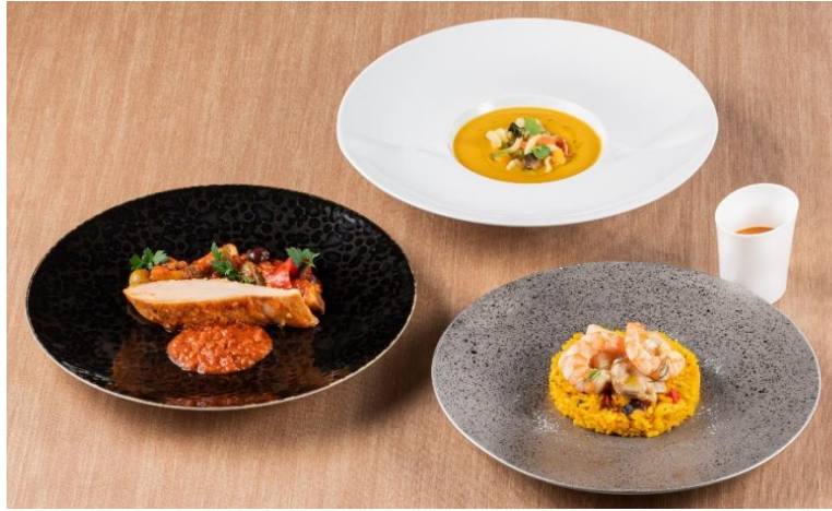
※画像は盛り付けのイメージです